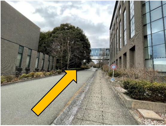
⑦道なりに突き当りまで直進