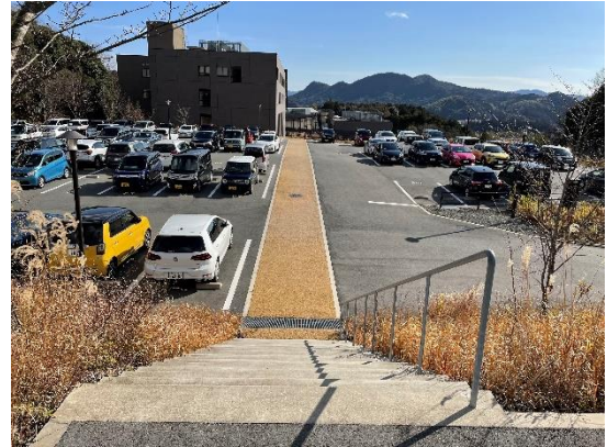
①階段を下りて直進する